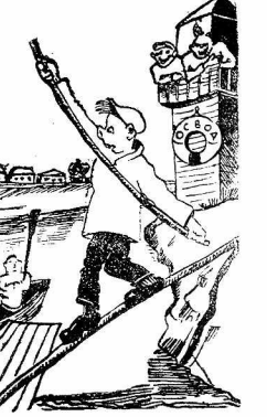
... и зрители из Освола

У перевоза через реку Вологда, около козавода, Освод никак не собирается устроить широкие трапы для стока пассажиров на молотки, к лодке. Имеются случаи увечья. (Из писем работников.)