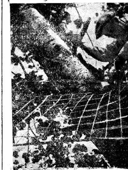
Работе инструментального пеха ремонтного завода в выходные дни школы организуют свой культурный отдых. На снимке: начальник цеха тов. Товчиленков и инструментальщик Ручников натягивают сетку для волейбола на берегу реки Вологда.