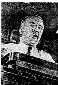
VII Всемирный конгресс Коминтерна. На сцене: выступление тов. Г. Поллиты (Англия)

После перерыва на трибуне президиума устанавливается: большая карта, показывающая развитие советских и партизанских районов Китая за вре-