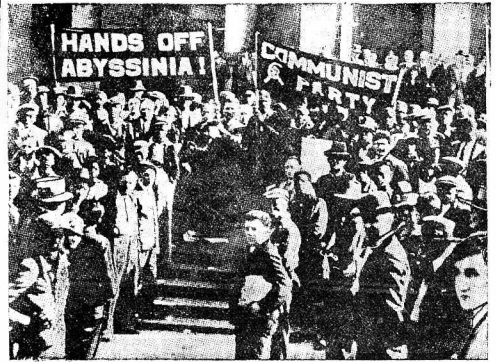
В Иоганнесбурге (Южная Африка) состоялся под руководством компартии многолюдная демонстрация протеста против подготовки Италии войны с Абиссинией. На снимке: демонстранты в Иоганнесбурге. На плакатах надпись: «Руки прочь от Абиссинии», «Компартия».

Приветствия закончены. Слово предоставляется первому докладчику знаменитому американскому профессору Вальтеру Кенону, директору медицинского института Харвардского университета в Бостоне. Проф. Кенон темой для своего доклада выбрал один из самых важных и интересных вопросов современной физиологии—деятельность так называемой нейро-гуморальной системы. Прежде чем перейти к этой теме, он сделал большое выступление, в котором характеризовал современное состояние мировой физиологии.