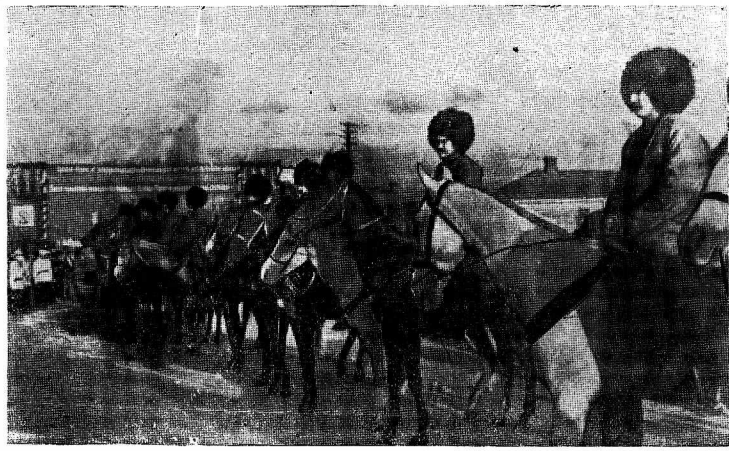
Участники конного пробега Ашхабад—Москва на финише у Абельмановской заставы.