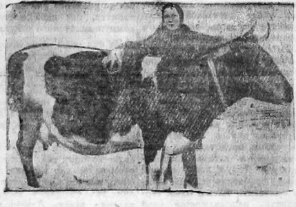
Лучшая корова колхоза имени Буденного «Красотка» и скотница Буденная

Состав бригады постоянный. Перед началом стойлового периода производят переучивание всех бригад — введено 5 новых дьяков, куда вошли комсомольцы.