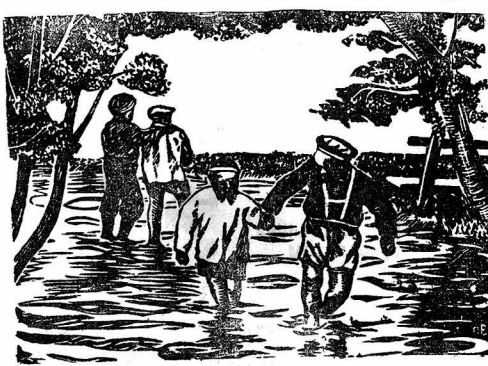
«После дождя». Гравюра на линолеуме художника-самоучки Павла Виноградова (ремонтный завод).