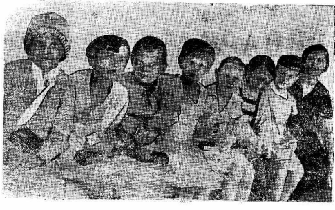
Детская площадка совхоза «Молаочное» в этом году подготовила и передала в первый класс начальной школы группу детей-дошкольников.