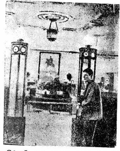
Общий вид нового зала отапы трамвайных пассажиров на Вологодском вокзале.