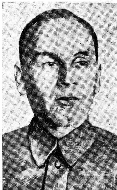
ставляла главным образом молодежь мелкобуржуазных слоев города),—что эта молодежь является барометром, по которому партия должна настраивать свою погоду, т. е. политику. Верный Ленину, преданный

Я позволю вам напомнить сегодня тот факт, что контрор-революционер Троцкий в своем «Новом курсе», атакуя ленинскую политику партии, указывая, что молодежь, и притом вузовская молодежь (а в то время вузовская молодежь из себя пред-