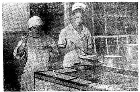
В краевом конкурсе столовых на лучшее оборудование слушателей столовая завода «Северный коммунар» вышла на первое место в городе.

Ежедневно в меню входит по 13 различных блюд. Калорийность обеды повышена с 500 до 787 калорий. За качеством обеды следит постоянное наблюдение санитарный врач.