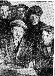
Во всех цехах завода «Северный коммунар» проведена митинг, посвященный включению производственного похода имени 18-й годовщины октября.

Устранение всех недостатков в школе создаст более спокойную обстановку в работе учителя, позволит переключить главное внимание на дальнейшее повышение качества учебной и воспитательной работы и внутреннюю дисциплину в школе, как этого требует наша партия и правительственный любящий вождь Сталин.