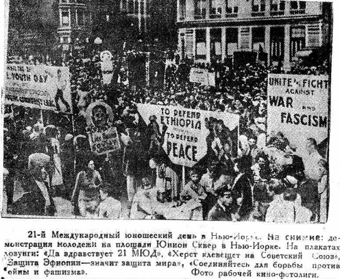
21-я Международная юношеская левая в Нью-Йорке. На снимке: демонстрация молодежи на площади Юнион Сквер в Нью-Йорке. На плакатах лозунги: «Да здравствует 21 МОД», «Херст является на Советский Союз», «Защита Фронтини—значит защита мира», «Соединяйтесь для борьбы против войны и фашизма».

Все лесотресты имеющие такие перевозки по Верхне-Волжскому, Камскому, Двиневскому, Двиневско-Двинскому, Московско-Осколково, Северному, Северо-Заволжскому партиям обязаны на основе телеграфной директивы Наркомлеса и Наркомлеса от 16 сентября передать паркомвodom максимальное количество лесотрестов и доложить главным управлениям о числе грузов, представляемых к дополнительной перевозке до конца навигации (ТАСС).