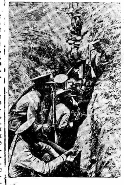
Абиссинская армия перестраивается по европейскому образцу. Часть армия за последние время получила новое европейское вооружение и оборудована.

«7. В течение больше чем 6 месяцев Италии, вопреки своим мирным заявлениям и вопреки состоявшемуся арбитражу, не прекращала посылку больших количеств войск, оружия военного снаряжения, подготовления танков и самолетов агрессии, которую она решила вернуть с момента прекращения периода дождей. Вопреки этой угрозе абиссинское правительство откладывало до последней минуты всеобщую мобилизацию своих сил. Прежде чем объявить решительный приказ, абиссинское правительство попросило Совет Лиги принять предостерегающие меры, которые извещали бы его от необходимости призвать весь народ к защите угрожаемой территории. Приказ о мобилизации