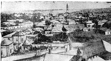
На снимке: г. Асмара, столица итальянской колонии Эритрея, откуда началось наступление итальянских войск в Сепар.