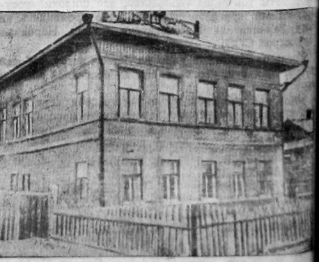
Дом на ул. Засодимского, где в 1910 году работал совместно Куйбышев, в организации и работе которого принимал участие Валерян Владимирович Куйбышев

СТОКГОЛЬМ, 26. Все газеты помещают телеграмму о смерти товарища Куйбышева его биографии. Орган шведской коммунистической партии сообщает по поводу смерти т. Куйбышева: «СССР и коммунистическая партия лишались одного из лучших своих борцов. Революционный пролетарский мир вместе с рабочими и крестьянскими массами СССР скорбит об этой тяжелой потере».