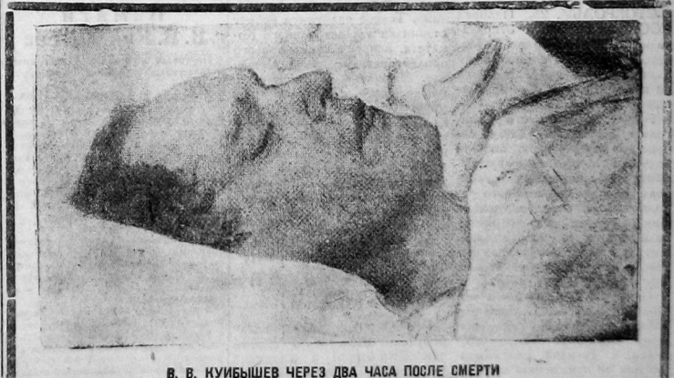
В. В. КУЙБИШЕВ ЧЕРЕЗ ДВА ЧАСА ПОСЛЕ СМЕРТИ

Позавчера с 8 час. утра до 22 часов прощаясь через Колонный зал 200 тысяч трудящихся.