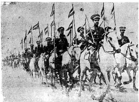
На снимке: абиссинская кавалерия.

«Я ограничусь несколькими замечаниями. Одно из них будет иметь скорее характер изложения моей концепции значения выработанных и принятых комитетом координации мероприятий. Эти мероприятия, хотя и представляют собой целую систему экономических санкций, все же не являются исчерпывающими. Иначе говоря, комитет координации не довел до конца возможных экономических санкций, так как он привнес во внимание множество обстоятельств, свойственных данному конфликту. Отсюда не следует, однако, что ограниченность принятых санкций представляет собой прецедент, на который позволительно будет ссылаться в других случаях агрессии, когда можно будет принять гораздо дальше идущие санкции. Если моя концепция не правильна, то вероятно председательствующий или другие делегаты меня поправят.