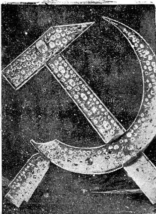
Трест «Русские самолеты» выполнил заказ на изготовление эмблем серпа и молота для звезд, которые украсят башни Кремля. Звезды изготовлены в Москве на заводах им. Мельникова, им. Мухоморова и заводе опытных конструкций ЦАГИ.

18. Товарищи красноармейцы и краснофлотцы! Будьте меткими стрелками, опытными артиллеристами, бесстрашными летчиками, мужественными танкистами, отважными подводниками! Пусть растет и крепнет, овладевает