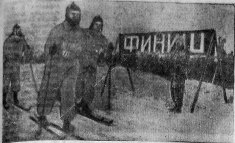
24 января в Москве состоялся физин Восточной звездной лигающей конференции железнодорожников, участвующей VII Всесоюзному съезду совет. На снимке: На физине.

Мы должны решительно искоренить факты механического подхода при приеме в комсомол, строго соблюдать и выполнять указания ЦК ВЛКСМ о том, что мы «должны все самое внимание сосредоточить на форсировании роста, на укреплении классового состава организации, очищая ее от классово-чуждых и приравнявшихся элементов, на усилении классовой закалки и беспособности каждого в отдельности комсомольца». Крепко развенчать действующую большевистскую, здоровую критику и самокритику, не заира на лица.