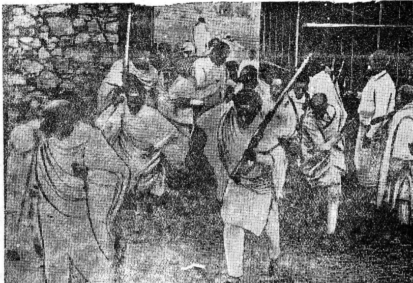
На снимке: абиссинские добровольцы получают в Аддис-Абебе оружие перед отправкой на фронт.

Для сохранения этого блага и поднимаются государства, входящие в Лигу наций. Движение это свободно и универсально. Народы, которые принимают в нем участие, воодушевлены стремлением объединиться перед лицом общей