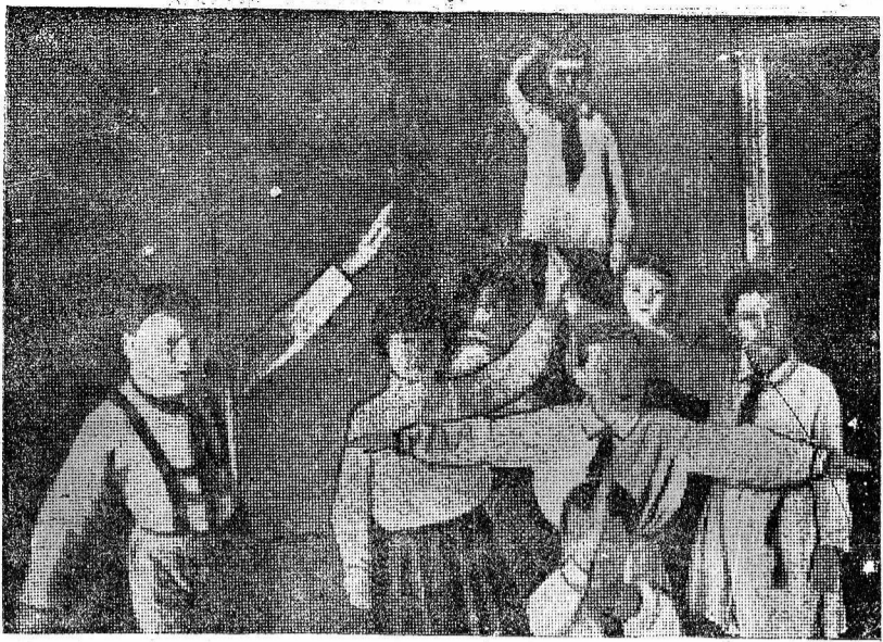
Пионеры отряда № 15 при заводе «Северный коммунар» готовятся к октябрьским торжествам. Они выступят с физкультурными номерами в клубе имени 1 мая и на детском утреннике. На снимке: Пионеры готовят пирамиду.