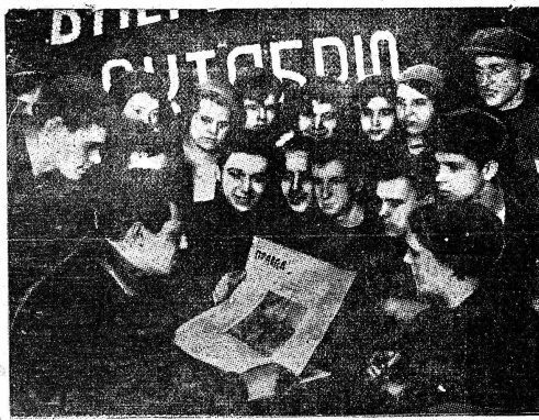
22 ноября на фабриках и заводах Москвы в объединенный перепись состоял до заседания митинга, на которых зачитывалась отчетная речь тов. Сталина на первом все союзном совещании рабочих и работников стахановцев промышленности и транспорта.

Разумно используя норма, организуя правильное содержание скота, наши колхозы и колхозники сумеют не только сохранить, но и значительно УВЕЛИЧИТЬ стадо в общественном и индивидуальном пользовании, памятуя, что без развития животноводства северному колхознику не быть зажиточным.