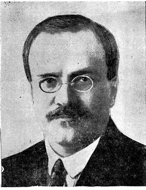
Только, они могут теперь на это рассчитывать.

Трудящиеся нашей страны почувствовали уже по-настоящему первые плоды победы своей революции. Они уже почувствовали значительное улучшение своей жизни, но, разумеется, они стремятся к дальнейшему, еще большему ее улучшению. И действи-