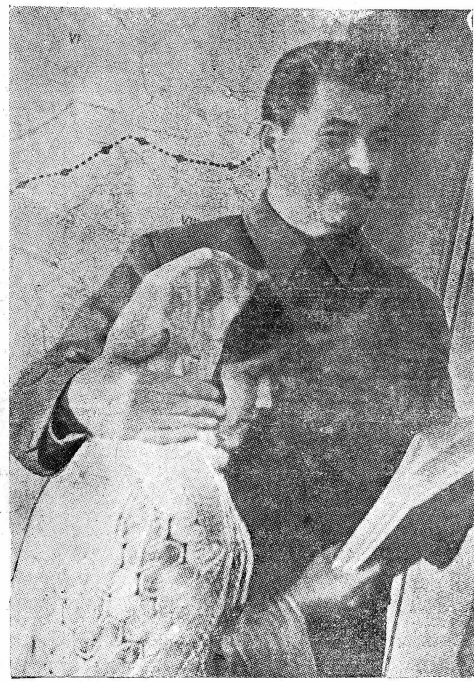
Совещание передовых колхозников и колхозниц Таджикистана и Туркменистана с руководящими работниками правительства (в Кремле 4 декабря 1935 года)

(Бурная овация, все присутствующие встает, возгласы: «Сталину ура!»).