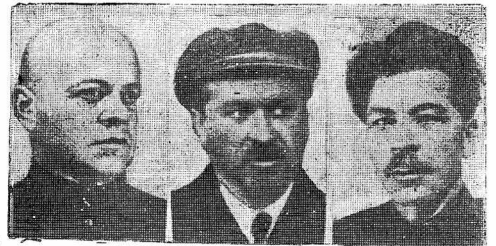
Награжденные орденом Ленина за выдающиеся успехи в области сельского хозяйства и промышленности—секретарь ЦК ВКП(б) Украины тов. Косиов С. В., председатель Совнаркома УССР тов. Любченко П. П. и первый секретарь Киевского областного комитета КП(б) Украины тов. Петренко П. П.

Заканчивая свою речь, товарищ Молотов сообщил, что президиум по предложению товарища Сталина решил представить всех участников совещания и высшей награды Советского Союза—орденам, преподнести им часы—женщинам—натурные золотые, мужчинам—наградные, патефоны с пластинками на национальных языках и премировать каждый колхоз, представленный на этом совещании, грузовым автомобилем. Заключительные слова речи товарища Молотова и внесенные им от имени президиума предложения были встречены взрывом оваций участников совещания, прерываемых приветственными возгласами на узбекском, казахском и каракалпакском языках: «ура Сталину, да здравствует наш зажиточный быт!» «Спасибо товарищу Сталину!» «Да здравствует товарищ Молотов, председатель СНК Союза!» «Тысячу раз спасибо правительству за счастливую жизнь и теплый прием!» Товарищ Молотов поочередно вылезает к столу президиума сначала колхозниц, затем колхозников, и товарищ Сталин, Молотов и Ворошилов вручают каждому участнику совещания подарки правительства.