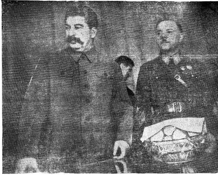
Совещание президиума колхозничек в колхозах Узбекистана, Кавказстана и Кара-Калпакии с руководителями партии и аппаратами 19 декабря и 1935 года. В центре: тов. Сталин и Ворошилов в президиуме совещания.

И когда в это движение вклю-чается не только даярка, но и руко-водители колхозов, специалисты, когда партийные и комсомольские организации действительно органи-зуют стахановское движение в жи-вотноводстве— колхозные фермы района несомненно на много повы-сят урожайность не только отдель-ных, лучших коров, но и всего стада.