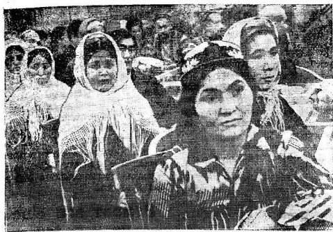
Совещание передовых колхозников и колхозниц Узбекистана, Кавказии и Кара Калкинии с руководителями партий и правительства 19 декабря 1935 г. На снимке: группа колхозниц на совещании.