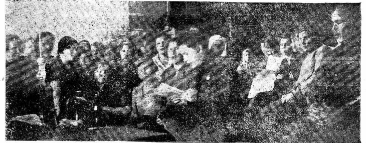
На снимке: Рабочие швейной фабрики им. Карла Дегтяря на митинге, посвященном декабрьскому Пленуму ЦК ВКП(б) во время обеденного перерыва 27 декабря.