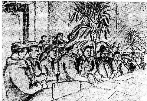
Рабочие паровозо-сборочного цеха ремонтного завода на митинге, посвященном проработке решений декабрьского Пленума ЦК ВКП(б).

26 декабря на заводах и фабриках Москвы состоялись митинги и беседы, на которых рабочие подробно обсуждали решения декабрьского Пленума ЦК ВКП(б). Решения пленума вызвали новую волну творческого подъема среди пролетариев красной столицы. Они берут на себя новые обязательства по повышению производительности труда, обещают достичь в 1936 году высших показателей в использовании оборудования.