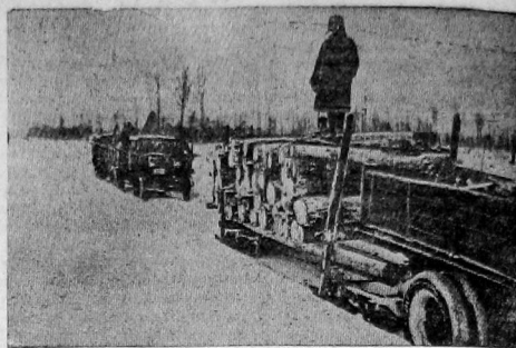
Любознательно и в сроч вывезти привесину! На отжиме — состав автомашин с лесом срисалос отправилс к месту свалки (Лажский лесопункт)