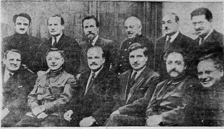
На снимке: сидят слева направо: заместитель председателя Совнаркома СССР и пред. госуд. плановой комиссии—т. В. Н. Межлаук, Народный Комиссар обороны т. К. Е. Ворошилов, председатель Совета Народных Комиссаров Союза ССР т. В. М. Молотов, зам. предс. Совнаркома т. В. Я. Чубарь, Народный Комиссар тяжелой промышленности т. Г. К. Орджоникидзе, Народный Комиссар по иностранным делам т. М. М. Литвинов. Стоит (слева направо): Народный Комиссар пищевой промышленности т. А. И. Микоян, Народный Комиссар легкой промышленности т. И. Е. Любимов, Народный Комиссар связи т. А. И. Рыков, Народный Комиссар водного транспорта т. Я. И. Пахомов, Народный Комиссар зерновых и животноводческих совхозов т. М. И. Калманович, Народный Комиссар внутренней торговли т. И. Я. Вейдер.