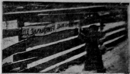
По станции 5 ж. д. отделения Сев. ж. д. проходила линия эстафеты имени VII съезда советов. Участие эстафеты брал тепло встречавший работников линейных станций.

Образцы хорошей работы мы имеем и среди учителей рядо-