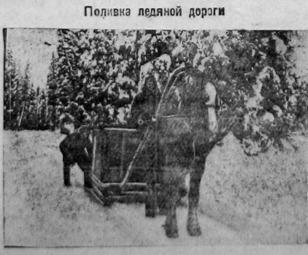
Подковка ледяной дороги