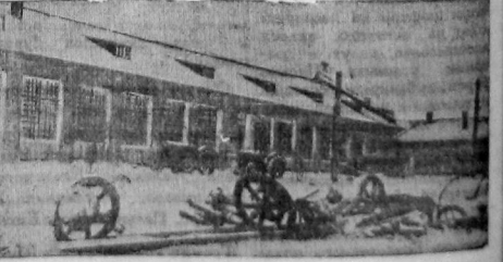
На снимке: Новая вологодская тракторная мастерская. Мастерская — пример замечательной сельскохозяйственной машинной части тракторной и грузовой автомобильной