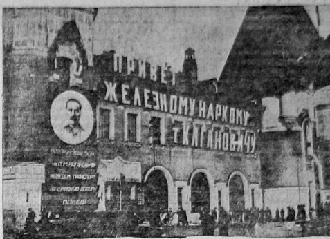
НА СНИМКЕ: здание вокзала Северной жел. дор. в Москве, украшенное лозунгами в связи с назначением т. Кагановича Народным Комиссаром путей сообщения.