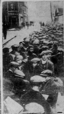
Суровая зима текущего года делает положение безработных на земле вдвойне тяжким.

На снимке: после колдованной охоты безработных у входа в благотворительную столовую за чашкой супа.