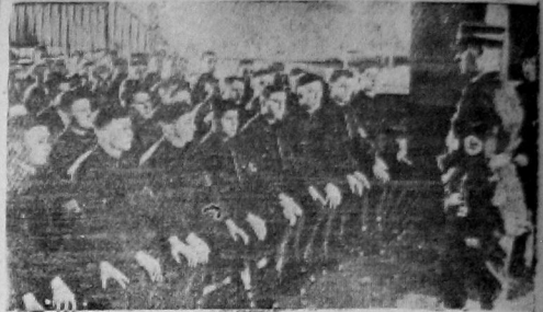
Из снимка: Штурмовик Кабачка потчевательно выслушивают вестальника начальника штурмового отряда в Люте.