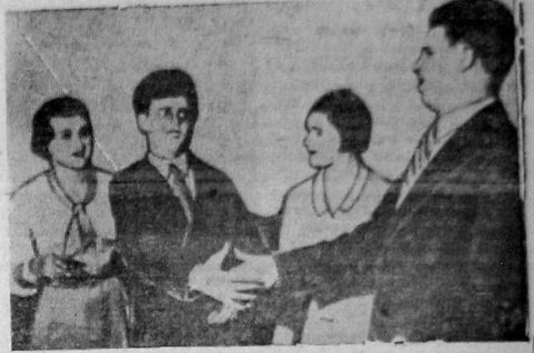
Сцена из комедии «Легкий человек» в постановке агиттеатра клуба железнодорожников.

Об этом надо позаботиться, за это надо бороться каждому клубу, каждому культурному работнику!