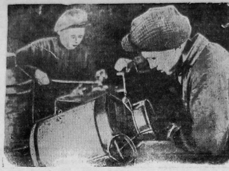
Ателье «Красный факел» изготавливает предметы ширпотреба для сельского хозяйства. На ФОТО: молодежная бригада Фабричной за изготовлением бытовое для юной холота.