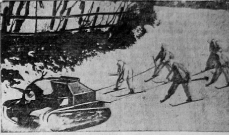
В польских Карпатах происходят маневры польской армии, на которых солдаты были одеты в целых маскировки в белых комбинезонах. На снимке: амфибии в маскировочных комбинезонах на буксире тянут.