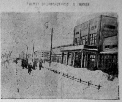
На снимке: одна из улиц Саратова. Справа — здание посольства английских многоэтажного дома.

На снимке: полиция на Берлинской улице собирает пожертвования.