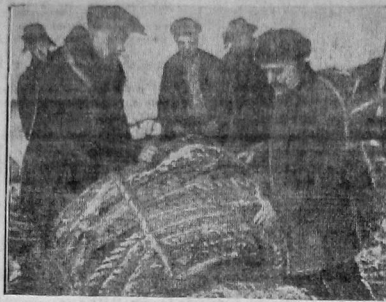
Десятки по сплаву в Великом швом лесодоме т. КОНО-ВАЛОВ осматривает полные снасти на сплаве на реке Великий