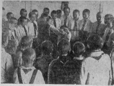
Веселятся пионеры из седьмой начальной школы. В круг вошел лучший папсу...