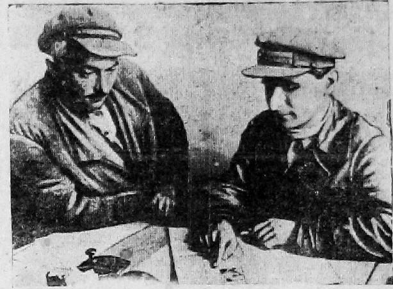
Сталинский устав колхозной жизни, выработанный лучшими людьми колхозов при ближайшем участии и под руководством тов. Сталина, показал с неоспоримой ясностью трудящимся единоличникам, до сих пор по каким-либо причинам оставшимся вне колхозов, что в колхозе они гораздо скорее и вернее, чем в единоличном хозяйстве, добьются успешнейшей культурной жизни. Пленум проработки примерного устава сельскохозяйственной артели на собраниях единоличников Гумиситинского сельсовета («Сухой кий р. и. Абазины») ряд единоличников в равной силе слова завлечены к приему их в колхозы. Многие подавали заявления тут же на собрании.

В этом году мы сделаем новый наев, зернохранилище, ригу и отремонтируем конюшню. План предусматривает поднятие двух гектаров целины и раскорчевки.