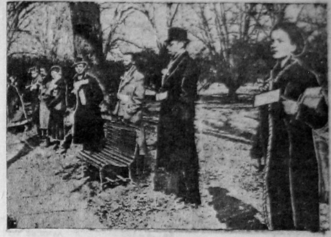
На снимке: Выступившие вдоль бульваров Вашингтона студенты и студентки с веревочными петлями на шее молча протестуют против участия в США самосудов над немцами.

Посмирую директора завода автомашины. Нарядный комиссар тяжелой промышленности С. Срджоникидзе.