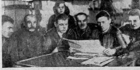
Рабочее дело Вологда за изучением приказа тов. Л. Кагановича о борьбе с аварийностью на транспорте