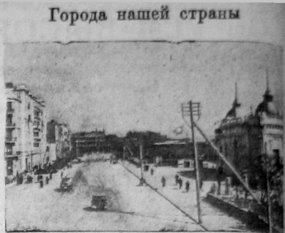
27 апреля—пятнадцатилетия советизации Азербайджанской ССР.

На снимке: Новый Бак, Набережная.