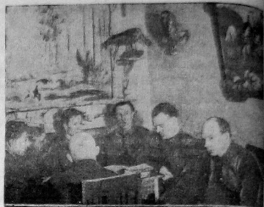
Занятия военно-охотничьей секции вологодского дома Красной армии в комнате охотника

Типография «Северный печатник» УМП Северного края в Вологде.