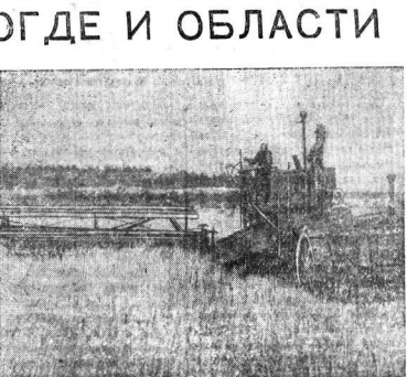
В прошлом году комбайнеры Заборской МТС, Тамбовского района Фекиста Николаева, Гусинская южная комбайнатор 21421 работала хлебом. Иначе ее комбайнатор работал бы. При легкой работе в 8 гектаров Ф. Гусинский убирает от 9 до 15 гектаров зерновых в день.

На стадионе «Динамо» произошла товарищеская встреча по футболу между командами «Динамо» (Вологда) и команда имени Свердлова (Вологда).