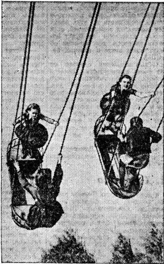
Знаменами сданы. Хорошо отдохнуть в парке Дворца культуры железнодорожников, поначавшись на качелях в солнечный день.

Начались школьные каникулы. Перед общественностью Вологодской области встала задача—организовать здоровый и разный отдых детей, оставшихся в городе. При школах открываются пионерские лагеря. От того, насколько продуманно и разнообразно будет в них работа, от того, как им будут помогать культурно-просветительские учреждения, зависит успех этого большого и нужного дела.