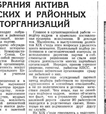
По родной земле

В своих единодушных решениях и в выступлениях коммунисты выражают горячую любовь и бесконечную преданность Сталину, коммунистическому руководству, готовность отдать все силы на выполнение заданий партии и правительства. В своих выступлениях участники собраний называют великого Сталина, волюнтер конкретные дела нового пятилетнего плана, одобряют решения ЦК и ЦКБ Коммунистической партии Советского Союза, одобряют единство коммунистов Вологодской области партийной организации.