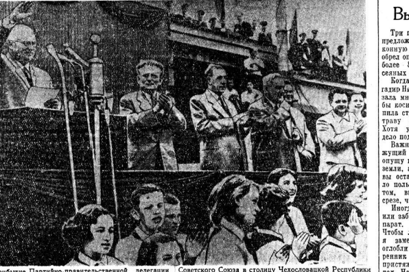
Пробытие Партии-правительственной делегации Советского Союза в столицу Чехословацкой Республики Прагу.

В своем смысле на митинге рабочих Словакии. Слева направо — Первый секретарь ЦК КПСЧ Н. С. Хрущев (на трибунах), Первый секретарь ЦК КПС А. Новотный, Президент Чехословацкой Республики А. Запотоцкий и Председатель Совета Министров СССР Н. А. Булганин. Снимок получен по фототелеграфу.