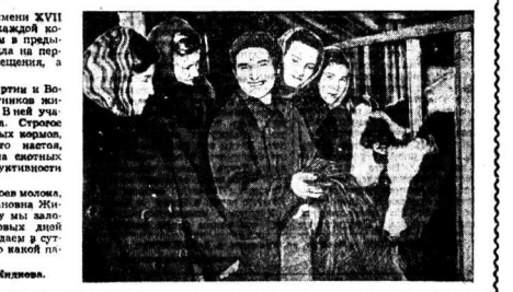
Текст и фото А. Жидкова.