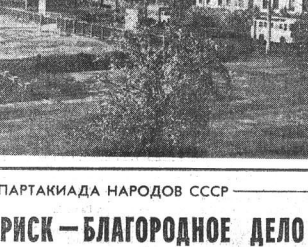
Архангельская область. В советское время эти малые народы получили равные права со всеми нашими и мировыми народами нашей страны.

В советское время эти малые народы получили равные права со всеми нашими и мировыми народами нашей страны. Теперь самые лучшие школы в благословенной полосе, а со стадами оленей и скотом на тундре живут так же, как и мы.