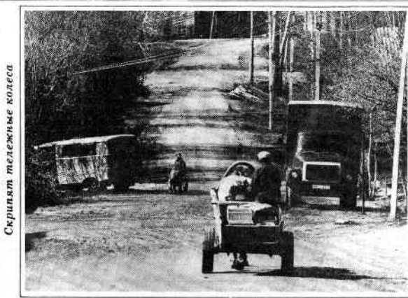
Скряпят теплые колеса

Коммунистов сменили демократы, вместо социализма, говорят, строят правовое общество и вводят в историческое русло. Но что получается? Опять то же. Критика всего, что было при социализме, и свободы не было, и народ нищенствовал, и с людьми не считались, и что партийные начальники