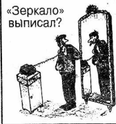
Окончание. Начало на 2 стр.

встречу, громко обсуждая видимые и невидимые достоинства каждого из нас. Мы им предложили встретиться на следующий день, возражений не последовало. Их координаты и телефоны до сих пор у меня где-то валяются. Во какой я молодец! Впрочем, не спешите завидовать. Сказал бы я вам на ушко - почему, но всенародно обобщать доверившихся мне дам было бы мужланством.