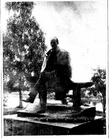
дышет его и моя душа. А может, все-таки душа - это нечто такое в нас, что не знает отдыха? Может, прав другой поэт, заявивший категорично: «Душа обречена трудиться и день и ночь, и день и ночь?»

За последние пять лет в стране уничтожено свыше более 200 тысяч зданий. Каждый год больше 400 тысяч человек лишаются крыш над головой.