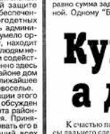
Фотосъемка с массового собрания в Вологодском районе.