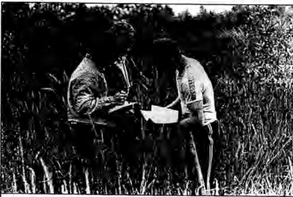
На снимке: полевое обследование берегов Кубенского озера студентами Вологодского государственного педагогического университета.

Исполнители убеждены, что к каждому водосточнику необходимо разработать технико-экономическое обоснование, учитывающее также и экологические аспекты. И только после сравнения эпит ТЭО можно выбрать каки-