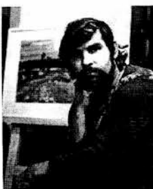
доступное вам как художнику. Я-то знала вас по преимуществу как отличного пейзажиста. А вы и исторический живописец, и искусный, тонкий портретист. Проживаемое время как-то влияет на выбор жанра?

- Вы пишете современную жизнь, постигаете ее через формы, краски. Чувствуете, как она меняется? - Да, большое общество медленно начинает выдвигаться, есть зримые сдвиги. Но сменилось-то все так неожиданно, и люди, естественно, оказались не подготовлены к этому. Не одно поколение должно смениться, пока жизнь снова войдет в нормальное русло, как было, когда ребенок рождался, его крестили и давали имя в честь его святого, воздвигали дома, в церкви и формировали определенный тип человека и общими усилиями достигали очень высокого уровня духовной общности, которого сейчас просто быть не может.