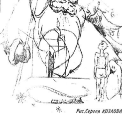
Рис. Сергея КОЗЛОВА.

Новый год - мой самый любимый праздник, и дни перед ним я тоже люблю. Тем более, что у меня каникулы.