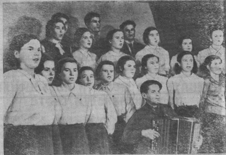
Культурно проводят свой досуг молодёжь Каменского нижнего склада Монзенского леспромпхоза.

На снимке: вечер художественной самодеятельности в Каменском рабочем клубе. Выступает самодеятельный хор под руководством Б. В. Туманова.