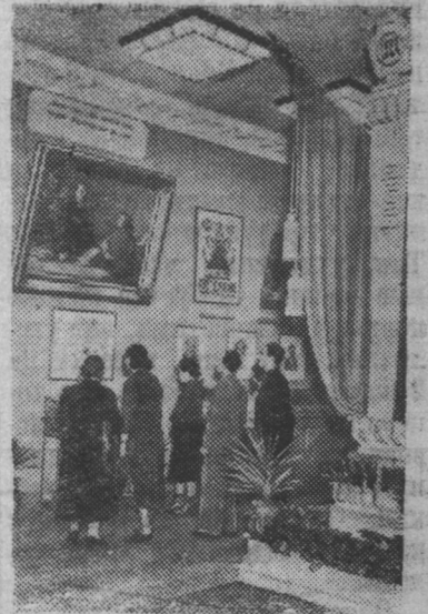
Москва. Выставка „Пятьдесят лет первой русской революции“ в Государственном Музее Революции СССР.

На балу побывало более 2 тысяч учащихся технических училищ. Для них был дан концерт мастеров искусств. (ТАСС).