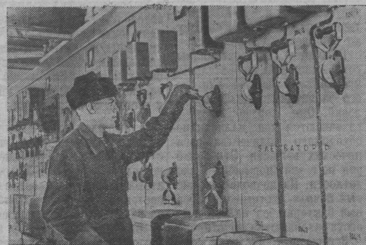
Углеобогатительная фабрика Череповецкого металлургического завода оборудована по последнему слову техники. Здесь все механизмы приводятся в движение электричеством. Бесперебойную работу электродвигателей обеспечивает дружный коллектив электриков, среди которого много демобилизованных солдат и матросов.

Единодушной подпиской на Государственные займы трудящиеся нашей страны демонстрируют своё морально-политическое единство и помогают партии и правительству успешно осуществлять грандиозные задачи по дальнейшему подъёму всех отраслей народного хозяйства, в укреплении экономической и военной мощи советского государства, в повышении материального и культурного уровня народа.