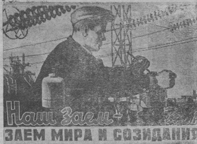
Плакат работы художника В. Сурьянинова. (Государственное издательство изобразительного искусства).