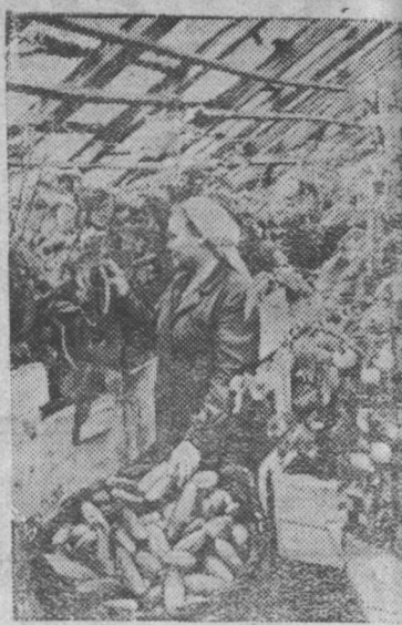
Овощеводы совхоза «Заречье» Вологодского района первые в области выращивают ранние овощи. Уже с конца апреля они начали собирать ранние огурцы. Ничего сбор ранних огурцов с закрытого грунта увеличивается по сравнению с прошлым годом на 30 процентов.