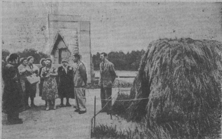
В Разлив, к памятнику-шалашу, ежедневно приезжают многочисленные экскурсии не только со всех концов страны, но и из-за рубежа.