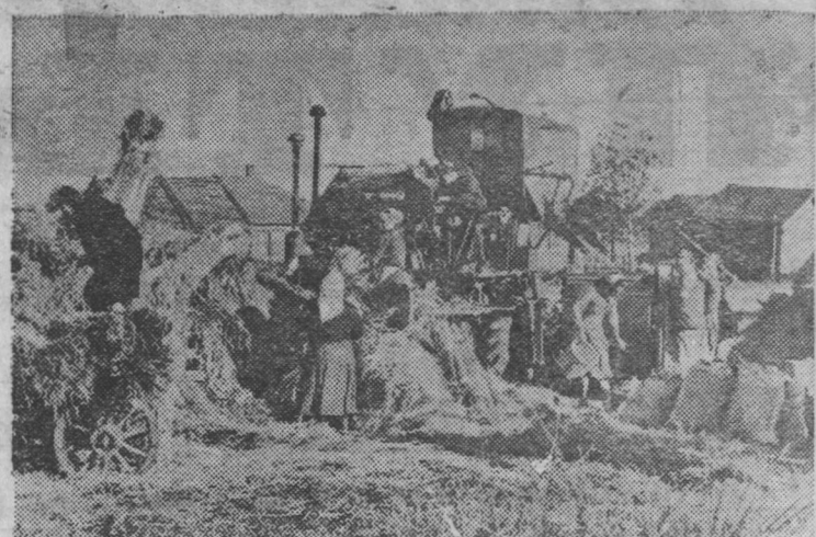
Полеводы колхоза «Красный партизан» Лежского района закончили косовицу озимой ржи на площади 156 гектаров. В дружестве с механизаторами Лежской МТС они ведут обмолот ржи. На снимке: молотба ржи во второй полеводческой бригаде.