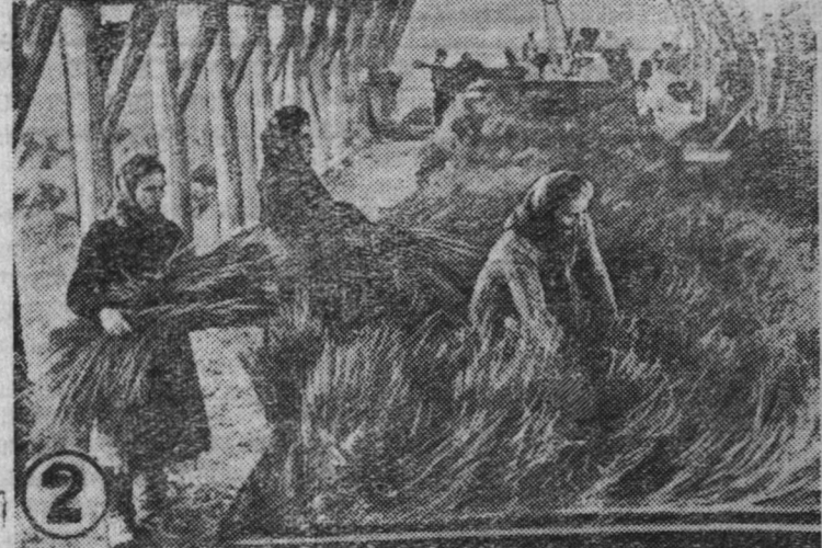
Льноводы колхоза „Память Ленина“, Лежского района, вырастили небывалый в колхозе урожай хорошего льна на площади 90 гектаров. Чтобы убрать урожай, обмолотить его, разостлать соломку и снять тресту со стлещ в нынешнюю неблагоприятную погоду, правление артели решило, сохраняя овины, внедрить современные механизированные сушильные средства, построить универсальную стационарную льносушилку.

Обработка льна на универсальной сушилке дала колхозу возможность перевыполнить обязательства по договору контрактации в четыре раза и сдать государству 684 пуда льносемян. Льноводы засыпали в общественные закрома достаточно льносемян для весеннего сева и продолжают сдавать их государству.